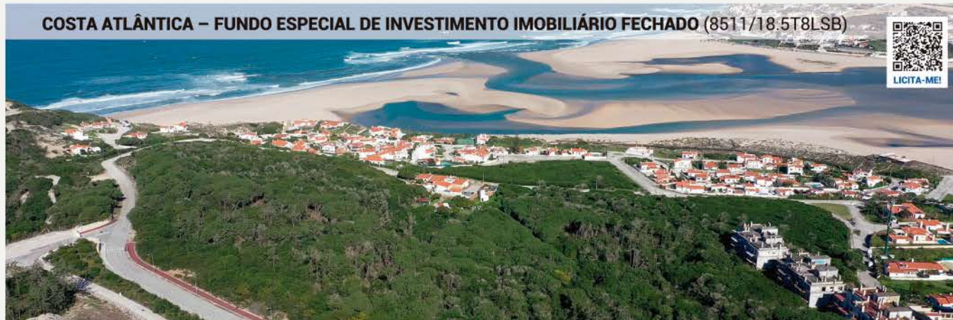
COSTA ATLÂNTICA – FUNDO ESPECIAL DE INVESTIMENTO IMOBILIÁRIO FECHADO (8511/18.5T8LSB)

Quinta do Bom Sucesso - Aldeia dos Pescadores · 2510-662 Vau, Óbidos