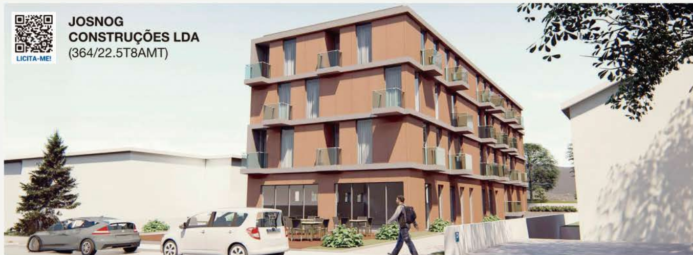
EDIFÍCIO COM 5 PISOS (Benfeitoria) · TERMAS DE SÃO VICENTE, PENAFIEL