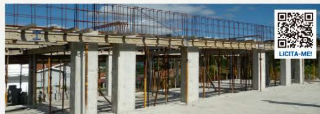
2 MORADIAS V3 GEMINADAS (Benfeitoria) TERMAS DE SÃO VICENTE, PENAFIEL