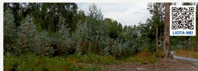
TERRENOS · VALPEDRE, PENAFIEL