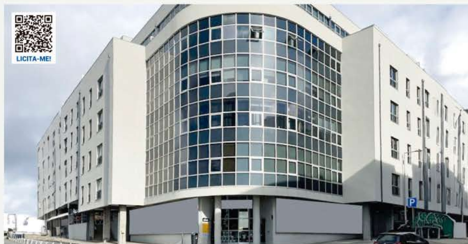
ESCRITÓRIOS + LUGARES DE GARAGEM · PORTO