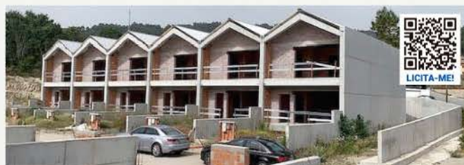
11 MORADIAS V3 EM BANDA (Benfeitoria) TERMAS DE SÃO VICENTE, PENAFIEL