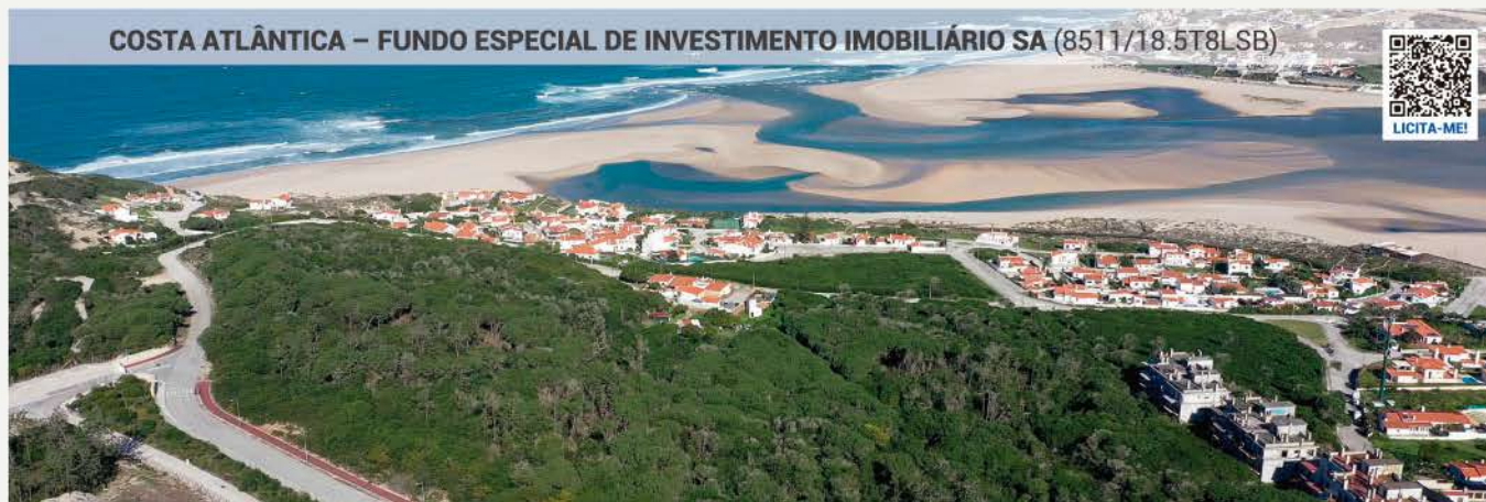
COSTA ATLÂNTICA – FUNDO ESPECIAL DE INVESTIMENTO IMOBILIÁRIO SA (8511/18.5T8LSB)

Quinta do Bom Sucesso - Aldeia dos Pescadores · 2510-662 Vau, Óbidos