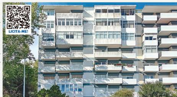
APARTAMENTO T3 · QUELUZ, SINTRA