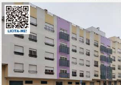
APARTAMENTO T2 ST.ª MARIA DA AZOIA, LOURES