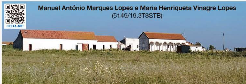
QUINTA COM 4,5 HECTARES · POCEIRÃO, PALMELA Moradia V2 · Edifício p/ Ativ. Agrícola (Armazém, Cavalariças e Vacarias) · 2 Poços