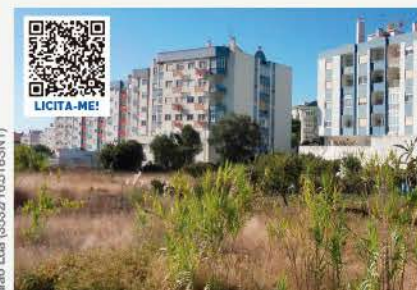
LOTES PARA CONSTRUÇÃO SANTA MARIA, SINTRA

900 · 1.400 Estes imóveis beneficiam de ISENÇÃO DE IMT e IS.