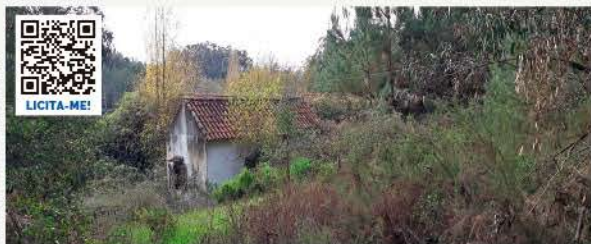
TERRENO COM +2,2 HECTARES RIO MAIOR, SANTARÉM