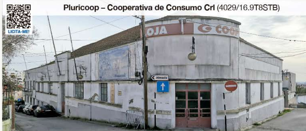
EDIFÍCIO (2 Pisos) COM 1.179,94 m² · PRAGAL, LISBOA

Pluricoop – Cooperativa de Consumo Crl (4029/16.9T8STB)