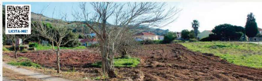
LOTE PARA CONSTRUÇÃO · TORRES VEDRAS