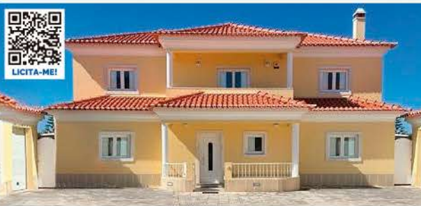
MORADIA V4 COM LOGRADOURO, PISCINA E 2 GARAGENS · AZEITÃO, SETÚBAL