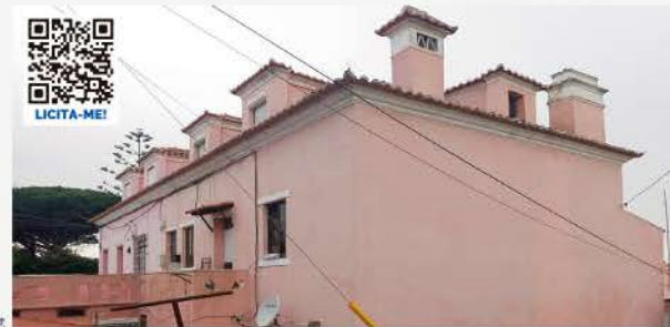
EDIFÍCIO COM 6 ALOJAMENTOS ALCABIDECHÉ, CASCAIS