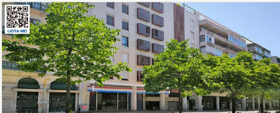
APARTAMENTO T3 RECUPERADO · LISBOA