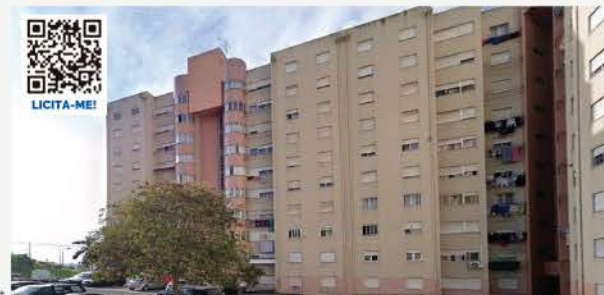
APARTAMENTO T2 SANTA MARIA DOS OLIVAIS, LISBOA