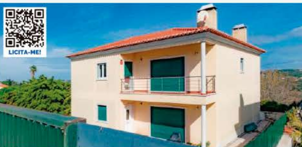
MORADIA V4 COM LOGRADOURO CARVOEIRA, MAFRA