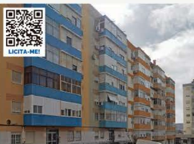
APARTAMENTO C/ ARRECAÇÃO PÓVOA DE S. ADRIÃO, ODIVELAS