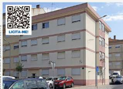
APARTAMENTO T2 BENAVENTE