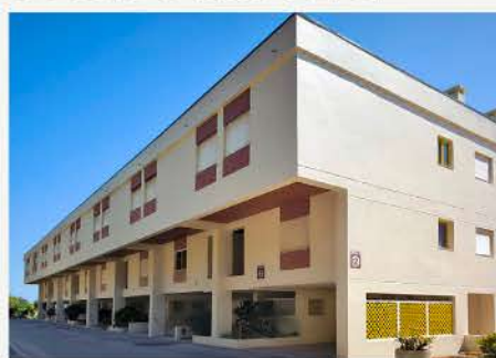
APARTAMENTO DUPLEX SANTIAGO, SESIMBRA