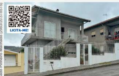
QUINHÃO HEREDITÁRIO SOBRE MORADIA V3 C/ LOGRADOURO S. JORGE, ST.ª MARIA DA FEIRA