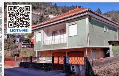
QUINHÃO HEREDITÁRIO SOBRE HABITAÇÃO E TERRENOS COIMBRA E MIRANDA DO CORVO