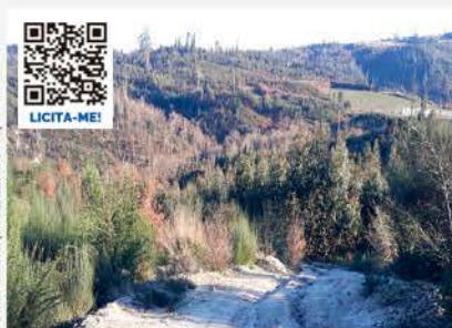
PROPORÇÃO DE 3/4 DE TERRENO SILGUEIROS, VISEU