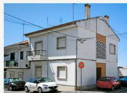
MORADIA (2 Pisos) SANTIAGO MAIOR, BEJA