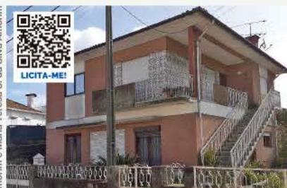
QUINHÃO HEREDITÁRIO SOBRE EDIFÍCIO E MORADIA LOUROSA, ST.ª MARIA DA FEIRA