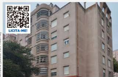
PROPORÇÃO DE 1/2 DE APARTAMENTO T2 SÃO SEBASTIÃO, SETÚBAL