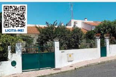
QUINHÃO HEREDITÁRIO SOBRE MORADIA V2 COM JARDIM PORTO SALVO, OEIRAS