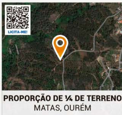
PROPORÇÃO DE 1/4 DE TERRENO MATAS, OURÉM