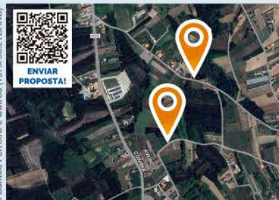
PROPORÇÃO DE 1/2 DE TERRENOS VILARINHO DO BAIRRO, ANADIA