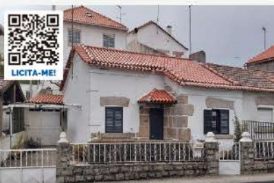
QUINHÃO HEREDITÁRIO SOBRE MORADIA V3 COM GARAGEM E LOGRADOURO · SÉ, GUARDA