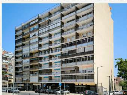
APARTAMENTO S. DOMINGOS DE BENFICA, LISBOA