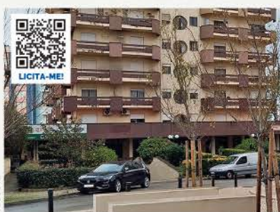
LOJA · COIMBRA