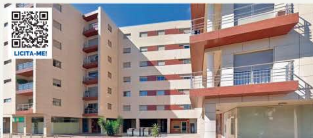
LOJA (EDIFÍCIO PORTO INFANTE) PAÇOS DE FERREIRA

Área Bruta Privativa: 136,85 Área Bruta Dependente: 8,70 2