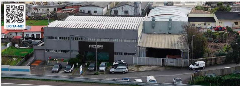
ARMAZÉM (3 Pisos) · ARCOZELO, V. N. DE GAIA

Travessa do Eirado 52 4410-510 Arcozele, V. N. de Gaia