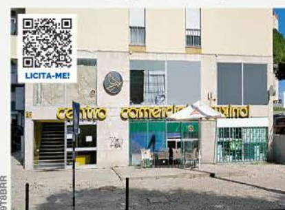
LOJAS · CORROIOS, SEIXAL