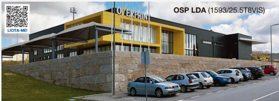
ARMAZÉM INDUSTRIAL · SERNANCELHE

Zona Empresarial de Sernancelhe 3640-290 Sernancelhe