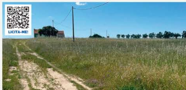
QUINTA COM 5,9 HECTARES · PALMELA